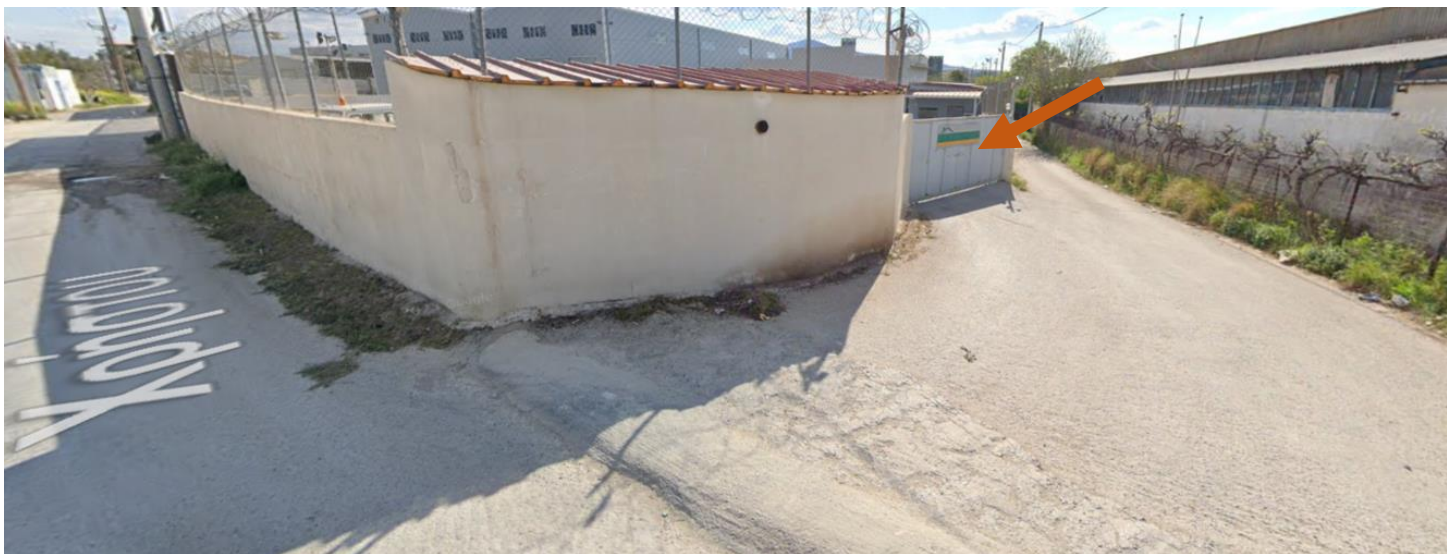
ΥΦΙΣΤΑΜΕΝΗ ΘΕΣΗ ΕΙΣΟΔΟΥ –ΕΞΟΔΟΥ ΕΠΙΡΗΣΗΣ

Προχωρήσαμε σε διορθώσεις και συμπληρώσεις, με νέα κατάθεση φακέλου που αφορούσε στην αλλαγή εισόδου – εξόδου και κατάργηση της υφιστάμενης θέσης καθώς και σε συμπλήρωση κατακόρυφης σήμανσης, υπέρ της επαύξησης της οδικής ασφάλειας, αφού η υφιστάμενη είσοδος δεν πληροί κανέναν όρο της κείμενης οδικής ασφάλειας. (βλ : φωτο_ΠΗΓΗ_GOOGLE)