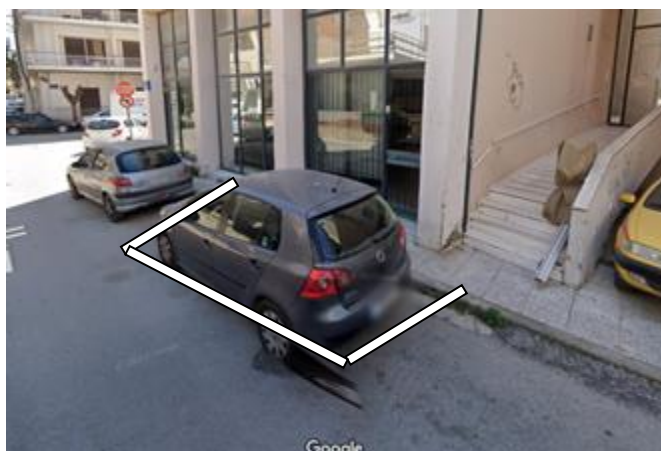
ΟΔΟΣ ΠΟΥΡΑΪΜΗ_ ΕΝΔΕΙΚΤΙΚΗ ΘΕΣΗ ΠΑΡΑΧΩΡΗΣΗΣ